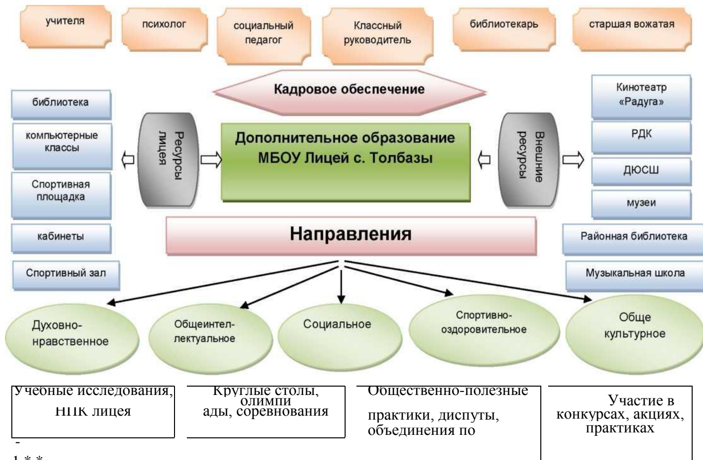
.Рис. Модель организации дополнительного образования учащихся в Лицее с. Толбазы

Реализация модели дополнительного образования в МБОУ Лицей с. Толбазы осуществляется через: