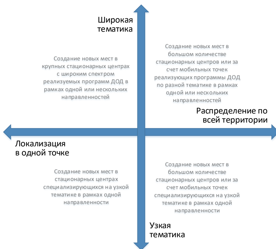
Рис. 3. Шкалы выбора масштаба и формы реализации новых мест по программам ДОД

При невыполнении хотя бы одного из них возникает необходимость пространственного распределения реализуемой модели через мобильные или сетевые решения.