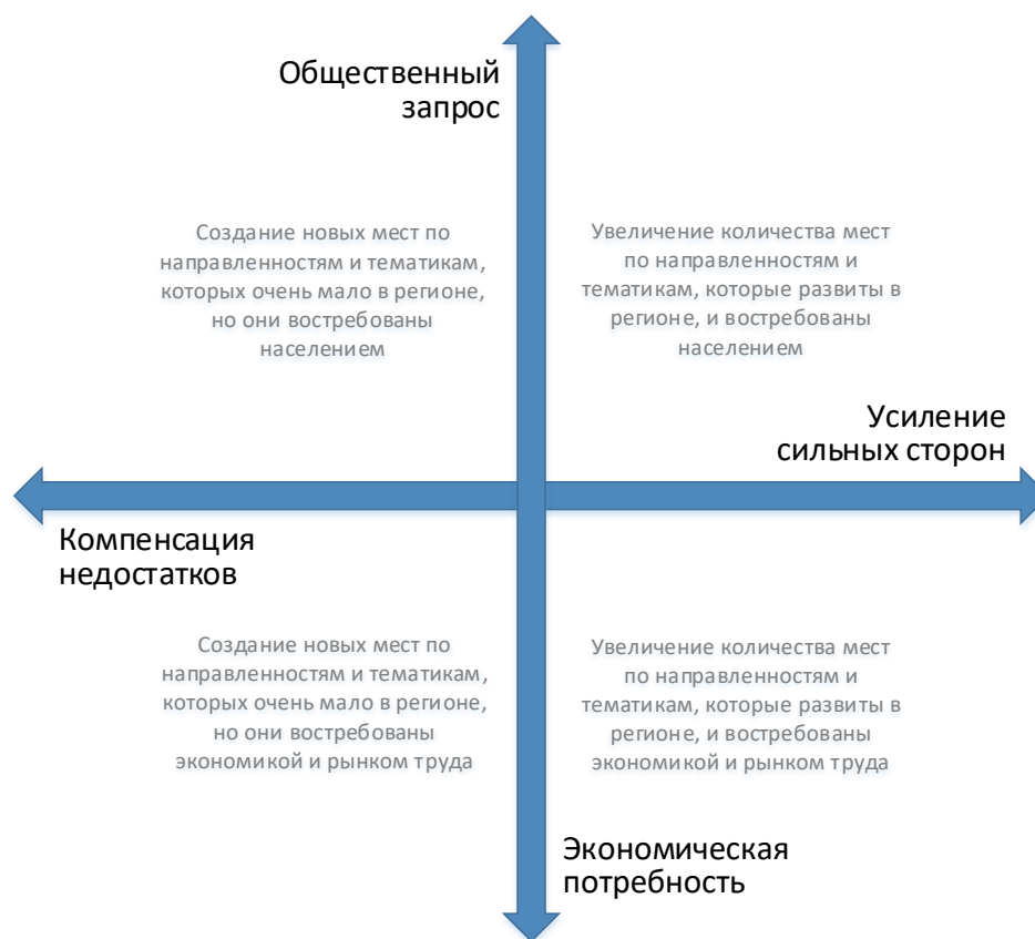
Рис. 2. Шкалы выбора тематики и тактики создания новых мест дополнительного образования