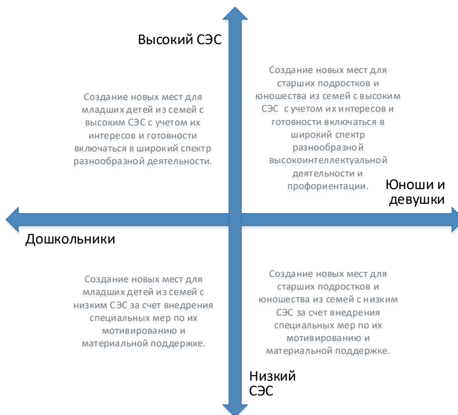
Рис. 5. Шкалы выбора модели создания новых мест по программам художественной направленности с учетом особенностей контингента обучающихся