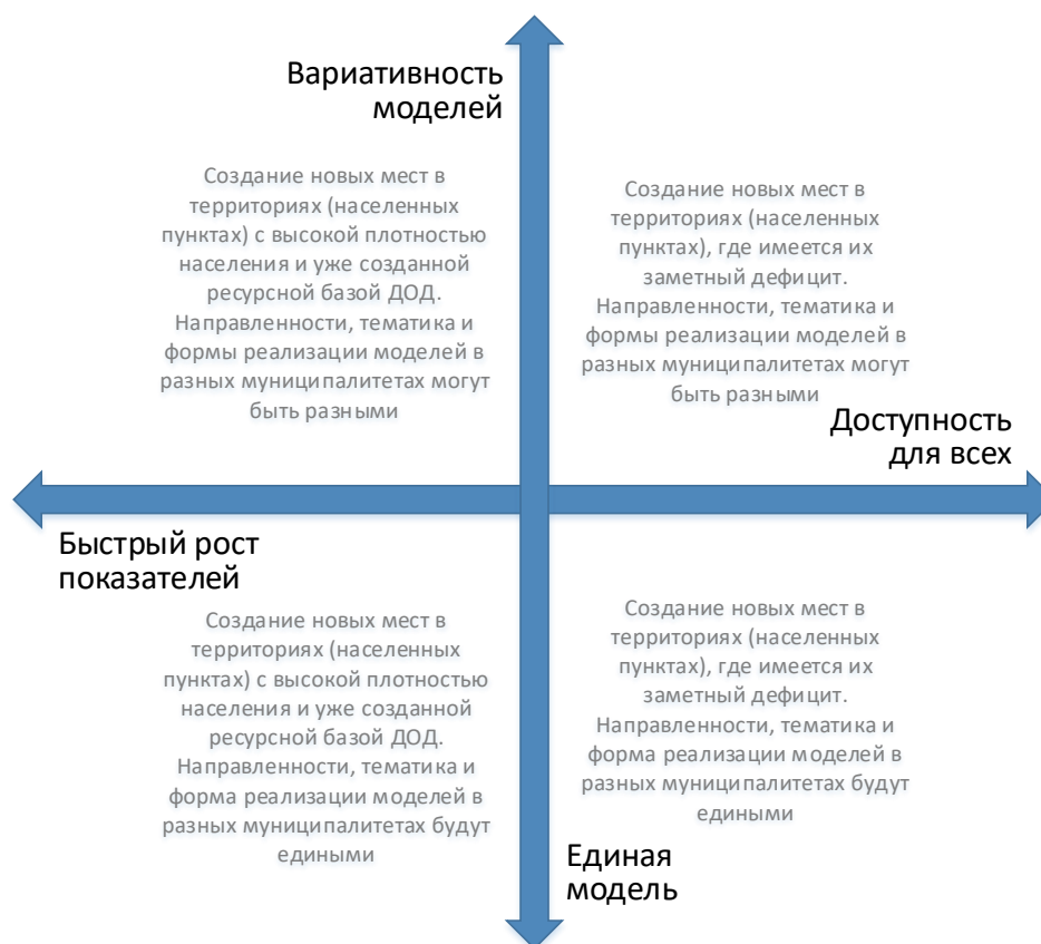
Рис. 4. Шкалы выбора модели создания новых мест с учетом актуальной управленческой политики